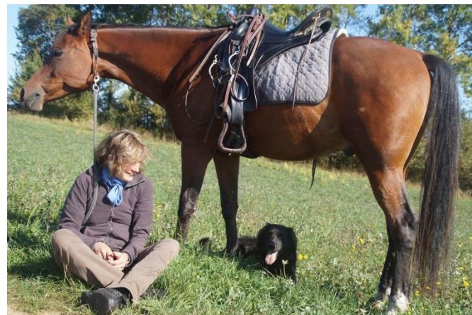
Ein gelassenes und vertrautes Dreierteam

Der Reiter sollte mindestens das Können und Wissen der VFD Ausbildung „Geländereiter“ besitzen. Das beinhaltet, dass er sein Pferd auch einhändig sicher reiten kann.