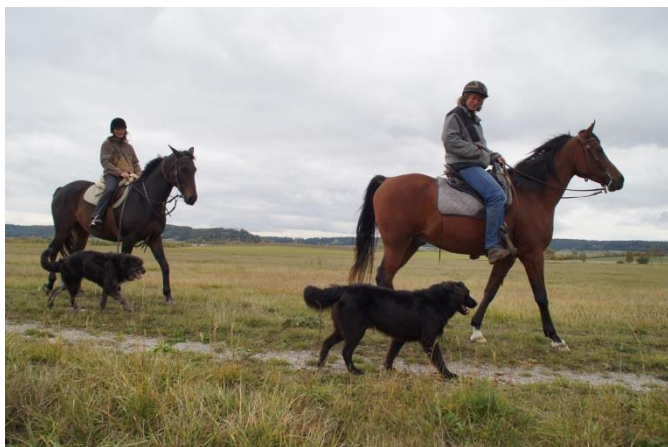
Die VFD Ausbildung zum Reitbegleithund – auch im Gelände sicher unterwegs

Jeder kennt das Bild: ein Reiter in freier Landschaft - begleitet vom bestem Freund des Menschen. Für manche mag das nur ein Traum sein, da er sich nicht traut, mit diesen beiden so unterschiedlichen Wesen die sichere Reithalle zu verlassen. Für andere Erholungssuchende ist es ein Alptraum – da doch immer wieder Reiter mit unkontrollierten Hunden unterwegs sind.