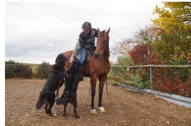
Eine große Herausforderung für das Fluchttier Pferd!

Das An- und Ableinen vom Pferd aus wird bei der Ausbildung geübt – eine wichtige Aufgabe, die im Gelände aber auch insbesondere im Straßenverkehr funktionieren muss.